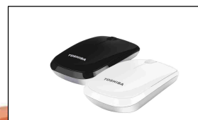
Toshiba W30 PA5155E-1TB (Negro)