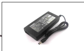
Adaptador adicional de corriente